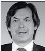
Carlo Messina ceo Intesa Sanpaolo