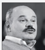
Oscar Farinetti fondatore di Eataly

Reputazione online ai massimi per il re del food che supera la compagnia di crociere. Al top anche Adr, Aeroporti di Roma